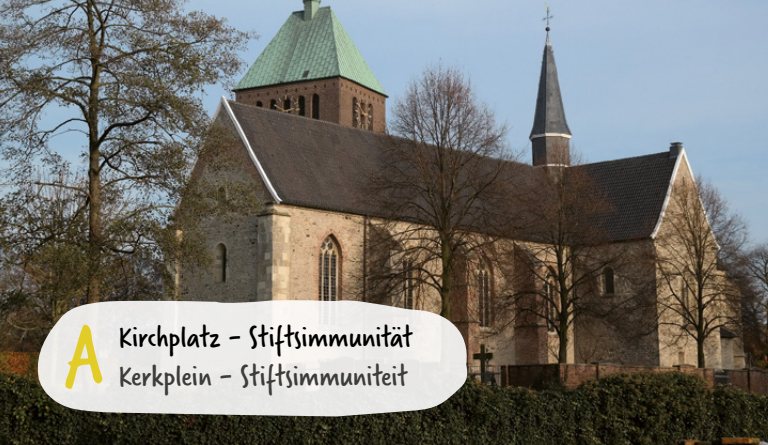
A Kirchplatz – Stiftsimmunität Kerkplein – Stiftsimmunität

Vreden zählt zu den frühen kirchlichen Zentren in Westfalen. Der Kirchplatz ist zugleich spirituelle Mitte und Ursprung des gräflichen Damenstifts, in das im Jahr 839 die Reliquien der hl. Felicitas kamen. Der Stiftsbezirk, die Immunität, ist noch heute im Stadtgrundriss ablesbar. Im Zentrum der Immunität stehen vermutlich seit dem 9. Jahrhundert zwei Kirchen nebeneinander. Der Kirchplatz wurde bis 1807 als Friedhof genutzt. Die Pfarrkirche St. Georg, 1957 als Neubau für den kriegszerstörten Vorgänger fertiggestellt, ist der siebente Kirchenbau an dieser Stelle. Die Stiftskirche St. Felicitas stammt in seinen ältesten Teilen aus dem 11. Jahrhundert und wurde nach 1945 wiederaufgebaut. Der Kirchplatz war jedoch schon vor Gründung des Damenstifts besiedelt, wie Ausgrabungsbefunde beweisen. Bestattungen aus vorchristlicher Zeit zeigen, dass diese Geländekuppe oberhalb der Berkel schon sehr früh ein spiritueller Ort war.