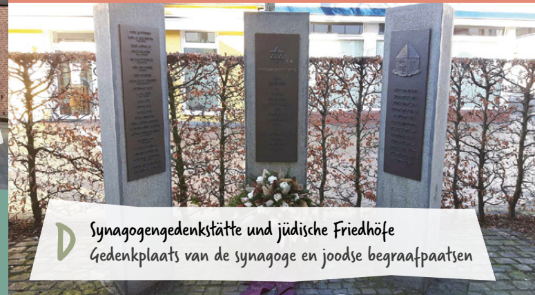
D Synagogengedenkstätte und jüdische Friedhöfe Gedenkplaats van de synagoge en joodse begraafplaatsen

In de Garten der Ruhe (rustgevende tuin), die van 1807 tot het jaar 2000 als begraafplaats diende, staan meerdere gedenkstenen die herinneren aan de beide wereldoorlogen. Op de gedenkzuil in de vorm van een Kruis, dat uit 1926 stamt, zijn de namen van de gevallen uit Vreden opgenomen. Een ander gedenkteken, dat in 1929 op initiatief van de Vereniging van (oud) militairen tot stand kwam, herinnert op een andere plaats eveneens aan de gevallen uit de Eerste Wereldoorlog. Tegenwoordig is het samengevoegd met het zandstenen gedenkteken uit 1960 ter herinnering aan de slachtoffers van de Tweede Wereldoorlog. Niet ver daarvandaan staat het leistenen monument „Die Wiederkunft“ („De Wederkomst“) ter herdenking van de gevallen en slachtoffers van de bombardementen in de Tweede Wereldoorlog.