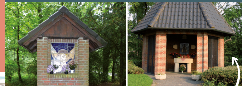
F Rosenkranzstationen und Kapelle am Langen Diek Rozenkranzstaties en de kapel aan de Langen Diek

In Vreden zijn enkele grafheuvels met daarin begraven stoffelijke resten als spirituele plekken uit het laat-neolithicum of vroege bronstijd bewaard gebleven. Zoals de twee grafheuvels in het beschermde natuurgebied het Crosewicker Grenzwald en in het Ammeloer Venn in Wennewick. In de jongere bronstijd (1200-700 v. Chr.) beginnen de crematies. In Vreden zijn uit die tijd ongeveer een tiental begraafplaatsen bekend. Op de gemeentelijke begraafplaats (aangelegd in 1970) aan de Zwillbrocker Straße werd de crematieplaats in 2002 ontdekt. Archeologisch onderzoek onthulde meer dan 80 graven met urnen of botresten. Als spirituele plek heeft de moderne gemeentelijke begraafplaats aan de Berkel dus een „lange traditie“!