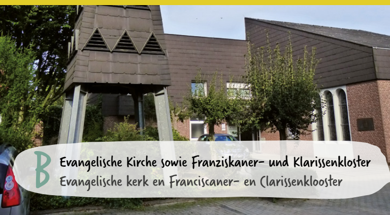
B Evangelische Kirche sowie Franziskaner- und Klarissenkloster Evangelische kerk en Franciscaner- en Clarissenklooster

Vreden is één van de vroegste kerkelijke centra van Westfalen. Het kerkplein is spiritueel middelpunt en tegelijk oorsprong van het stift voor adellijke dames, waarin in het jaar 839 de relikwieën van de H. Felicitas kwamen. Het Stiftsgebied, de Immunität, waar de rechtsmacht in handen lag van de abdis, is nog vandaag in de stadsplattegrond herkenbaar. In het centrum van de Immunität staan, vermoedelijk sinds de 9e eeuw, twee kerken naast elkaar. Het kerkplein werd sinds 1807 als begraafplaats gebruikt. De parochiekerk Sint Georg is de zevende kerk op deze plaats, in 1957 als nieuwbouw gereedgekomen in plaats van de in de oorlog verwoeste voorganger. De Stiftskerk Sint Felicitas stamt voor wat betreft de oudste delen uit de 11e eeuw en werd na 1945 weer opgebouwd. Het kerkplein werd echter al voor de stichting van het Damesstift bewoond, zoals opgravingsvondsten bewijzen. Begravingen uit voorchristelijke tijden laten zien dat deze verhoging boven de Berkel in het terrein al zeer vroeg een spirituele plek was.