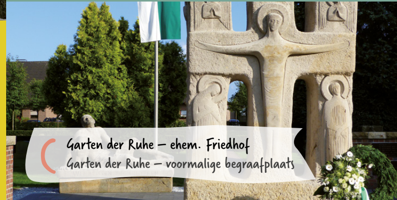
C Garten der Ruhe – ehem. Friedhof Garten der Ruhe – voormalige begraafplaats

De Klosterstraße wijst sinds de tijd van de Barok op spirituele plekken. Op het stuk grond van het huidige Kettelerhaus werd in 1650 een Clarissenklooster gesticht en al in 1640 werd aan de andere kant van de straat een Franciscanenklooster gegrondvest, waarin door de paters in 1677 het Vredense gymnasium werd gesticht. Beide kloosters werden in 1811 opgeheven – in datzelfde jaar zijn beide kloosters bij de stadsbrand verloren gegaan. Op het grondstuk van het Franciscanenklooster richtte de evangelische kerkgemeenschap in 1859/60 een neoromaans kerkgebouw op. Dit gebouw werd in 1973 afgebroken en door het huidige gemeentecentrum vervangen, dat in 1982 met een kerktoren werd voltooid (B1). Ook de in 1857/1858 gestichte begraafplaats (B2) aan de Bahnhofstraße getuigt van de evangelische kerkgemeenschap.