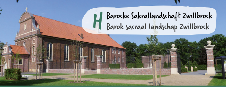
H Barocke Sakrallandschaft Zwillbrock Barok sacraal landschap Zwillbrock