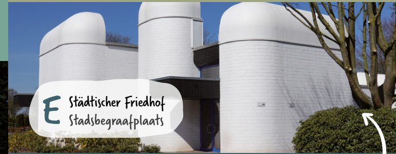
E Städtischer Friedhof Staatsbegraafplaats

Sinds het jaar 2000 markeert een gedenkteken (D1) in de Twickelerstraße de plaats waar de uit 1808 stammende Synagoge van de joodse gemeenschap Vreden stond. Het gebedshuis werd in 1938 in de Pogromnacht verwoest en in 1944 afgebroken. Het gedenkteken vormt jaarlijks op 9 november het centrale punt voor de herdenkingsbijeenkomst ter gelegenheid van de Pogromnacht. Aan de geschiedenis van de Joden in Vreden herinneren ook de begraafplaatsen aan de Oldenkotter Straße (D2) en aan de straat Berkelaue (D3).